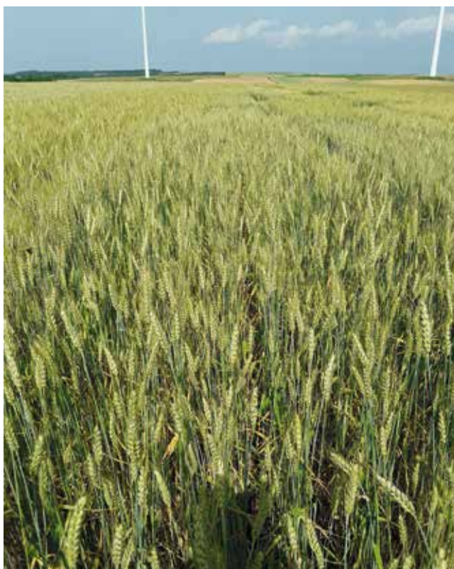
Die Sorte Aristaro ist steinbrandresistent und für österreichische Anbaubedingungen gut geeignet.

kann entscheidend zu einer vorbeugenden Beikrautregulierung beitragen.