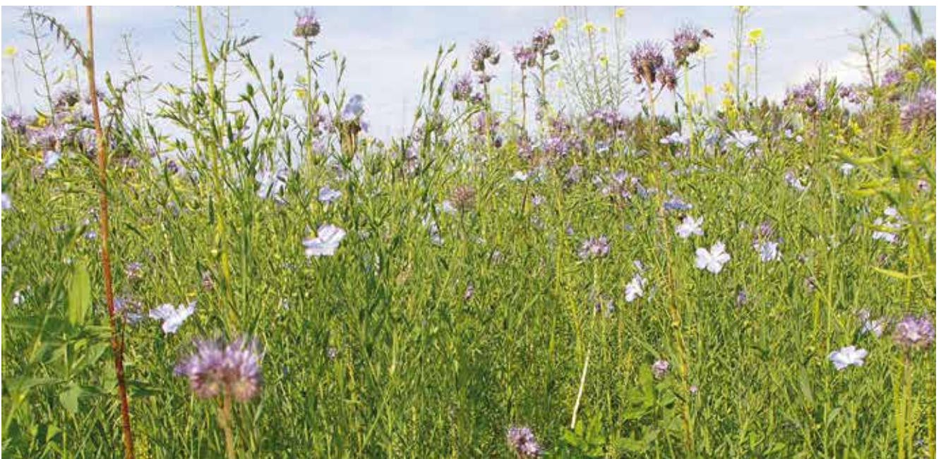
Als Begrünung sollten immer (möglichst vielfältige) Gemenge angebaut werden.

Achtung: Pflanzenarten, die regelmäßig als Hauptfrucht im Betrieb angebaut werden, sollten nicht zusätzlich auch im Begrünungsanbau zum Einsatz kommen. Dies betrifft vor allem Körnerleguminosen.