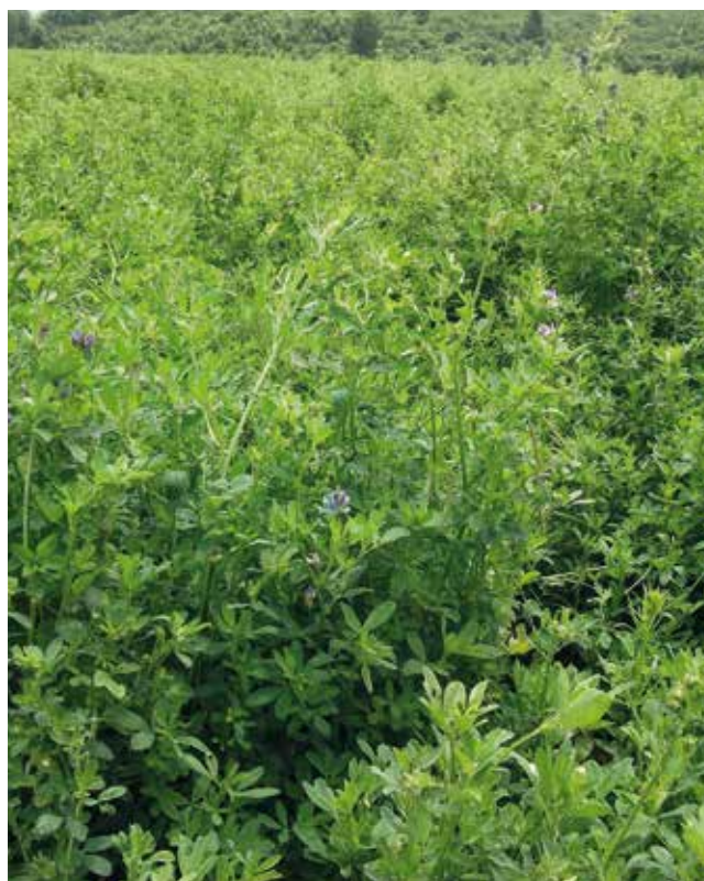
Kleegrasbestände bringen vielfältige Leistungen für die Bodenfruchtbarkeit.

Obwohl im viehlosen Ackerbau für den Klee- bzw. Luzerneaufwuchs meist keine Verwertungsmöglichkeit