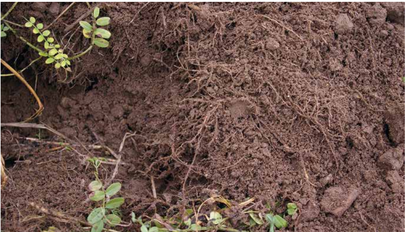
Über einen möglichst engen Wurzel-Bodenkontakt mit entsprechend großen reaktiven Oberflächen werden von der Wurzel Assimilate in die Rhizosphäre abgegeben und im Gegenzug Bodennährstoffe aufgenommen, die von den „angefütterten“ Mikroorganismen mobilisiert wurden.

Der Leguminosenanbau trägt den Stickstoffhaushalt von Bioackerbaubetrieben. Die Luftstickstoff-Fixierung der Leguminosen steigt mit ihrer Ertragsleistung. Wich-