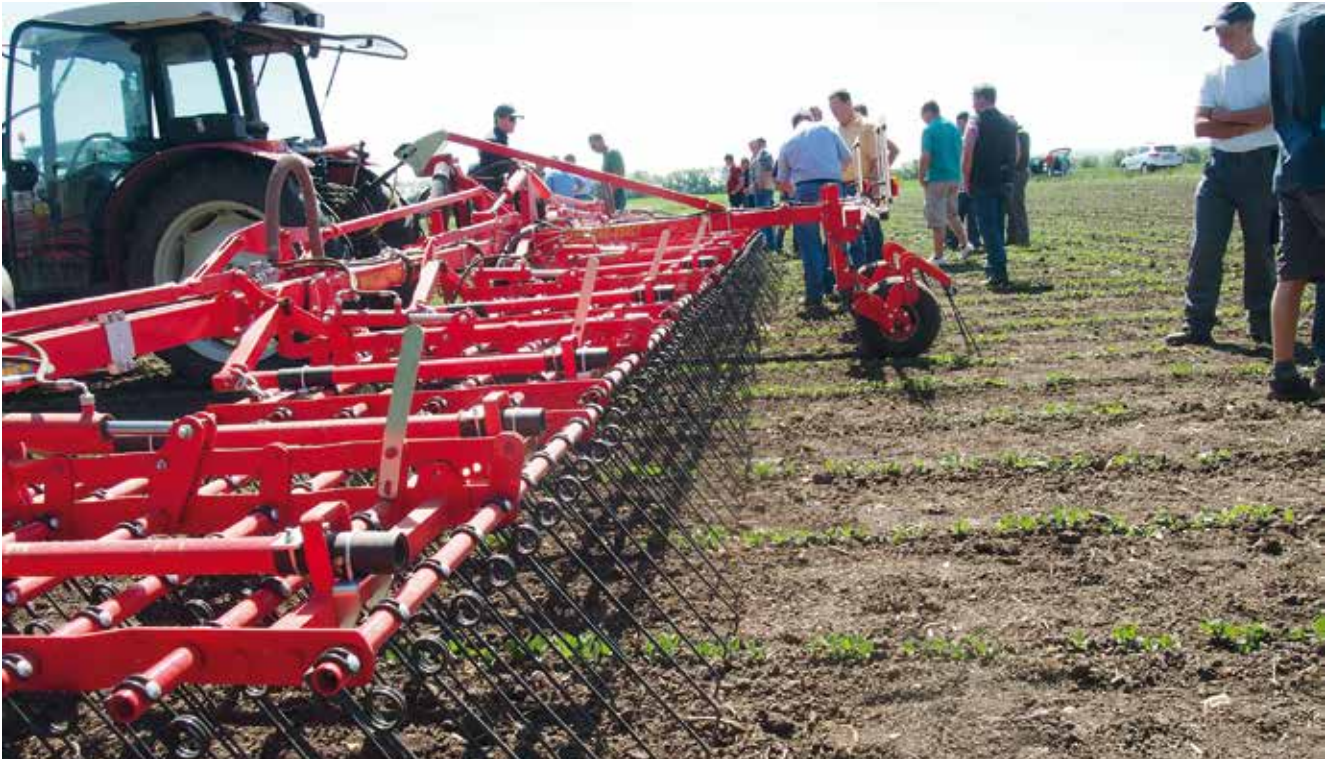
Aerostar Exact von Einböck