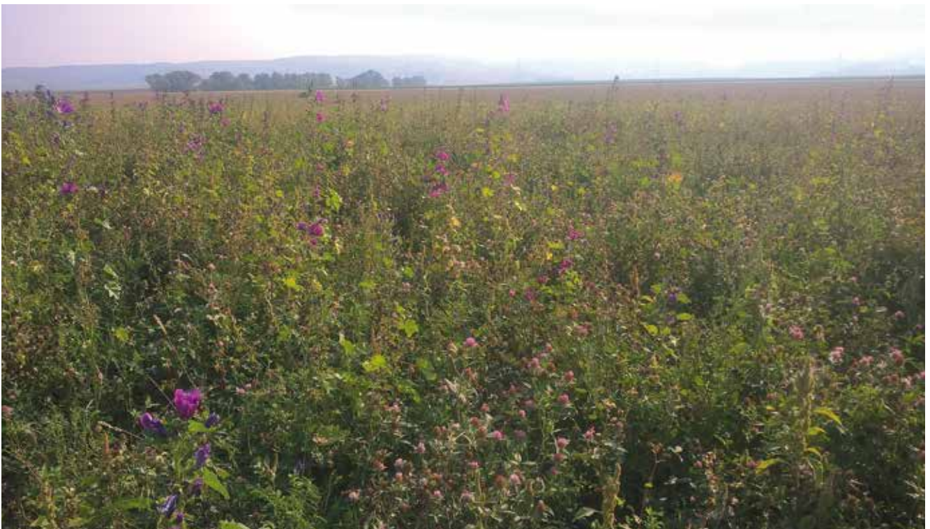
Blühflächen bringen im Biobetrieb einen Mehrwert im Sinne einer funktionellen Biodiversität, indem Sie über die Förderung von Nützlingen zur vorbeugenden Regulierung von Schaderregern beitragen können.

Beträgt die Ackerfläche des Betriebes mehr als 5 ha, sind maximal 75 % Getreide und Mais zulässig. Zusätzlich darf keine Kultur mehr als 55 % Anteil an der Ackerfläche haben (ausgenommen Ackerfutter). Mischkulturen werden jener Kulturart zugerechnet, die dem Hauptanteil der Mischung entspricht.