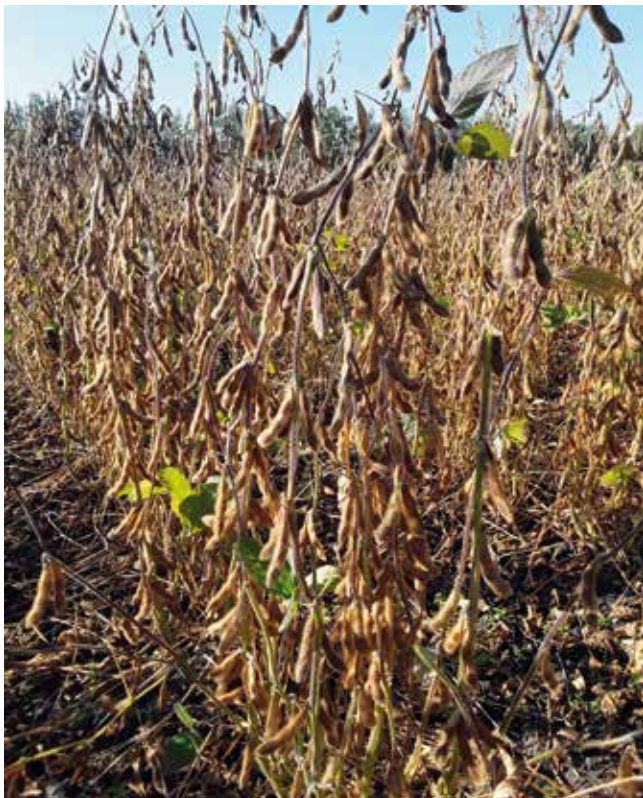
Die Sojabohne weist meist eine negative Stickstoffflächenbilanz auf.

Körnerleguminosen (Körnererbse, Ackerbohne, Wicke, Lupine ...) haben einen geringeren Vorfruchtwert als Futterleguminosen und brauchen Fruchtfolgeabstände von vier bis sechs Jahren und mehr als Vorbeuge gegen Fußkrankheiten. Einen Sonderfall stellt die Sojabohne dar, die derzeit noch eine relativ hohe Selbstverträglichkeit aufweist. Andererseits entzieht die Sojabohne speziell bei hohen Erträgen über das Erntegut mehr Stickstoff als sie über die Wurzelknöllchen assimiliert, so dass sie im Biolandbau häufig zum Stickstoffzehrer wird. Um eine optimale Luftstickstoff-Fixierung im Sojaanbau sicherzustellen ist eine zusätzliche Beim-