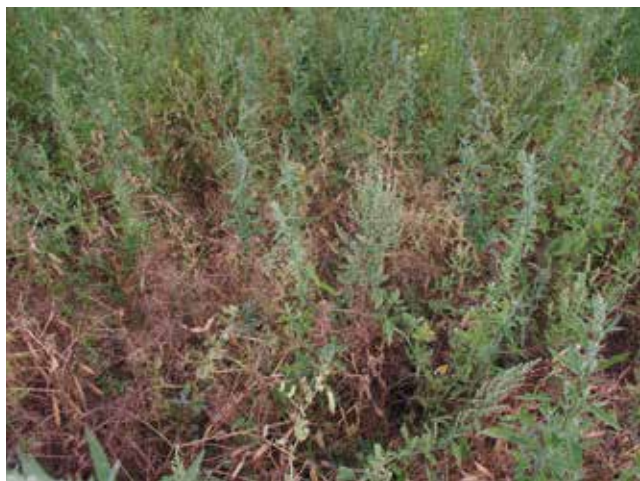
Der weiße Gänsefuß ist ein typisches Beikraut in Körnerleguminosenbeständen. In einem Wintergetreidebestand kann sich diese Art nicht etablieren.

Zu hohe Weizenanteile in der Fruchtfolge erhöhen die Gefahr des Auftretens des Weizensteinbrands. In dem Zusammenhang sind auch die Weizenverwandten Dinkel, Durum und Einkorn/Emmer zu berücksichtigen. Speziell im Trockengebiet gewinnen im Boden überdauernde Sporen zunehmend an Bedeutung im Infektionsgeschehen des Weizensteinbrands. Zur Steinbrandvorbeuge werden Mindestanbauabstände für Winterweizen und Weizenverwandte von drei bis vier Jahren empfohlen. Für den Weizenbau auf Flächen, für die eine Steinbrandbodeninfektion nicht ausgeschlossen werden kann, sollte nach Möglichkeit auf steinbrandresistente Sorten zurückgegriffen werden.