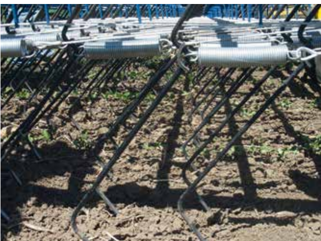
Exaktstriegel von Treffler

Rollstriegel haben aufgrund ihrer geringeren Verstopfungsanfälligkeit ihre Stärken vor allem in Mulchsaatbeständen.