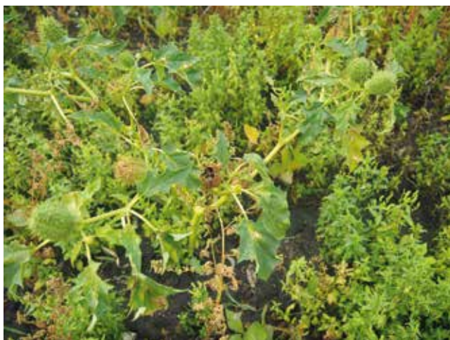
Stechapfel braucht hohe Keimtemperaturen und wird daher durch Fruchtfolgen mit hohem Anteil an spät angebauten Sommerungen (Soja, Mais, Hirse) gefördert.

Einjährige Beikräuter können gemäß ihrer Keimbilologie grob in Herbstkeimer, Frühjahrskeimer und Wärme- bzw. Spätfrühjahrskeimer eingeteilt werden 2 und sind demgemäß eher an Winterungen oder Sommerungen angepasst. Durch den regelmäßigen Wechsel von Winterung und Sommerung kann daher eine einseitige Selektion bestimmter Beikrauttypen verhindert werden. Generell ist eine vielfältige Beikrautflora ohne dominante Arten leichter vorbeugend zu regulieren als durch falsche Bodenbearbeitung oder Fruchtfolgegestaltung selektierte „Problemunkrautsituationen“. Dieser regelmäßige Wechsel zwischen Winterung und Sommerung gewinnt aktuell im Zusammenhang mit der Vorbeuge gegen Neophyten wie den gemeinen Stechapfel neues Gewicht!