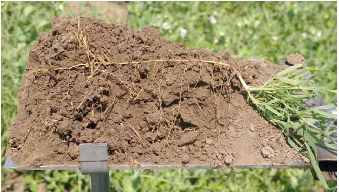
Ein gut durchwurzelbarer Boden steht im Mittelpunkt des Bioackerbaus.

bau von Hauptfruchtleguminosen und Leguminosenbegrünungen sichergestellt. Vorbeugende Pflanzenschutzmaßnahmen, unter anderem auch über die Förderung der Biodiversität in der Agrarlandschaft (funktionelle Biodiversität), haben absolute Priorität. In der Tierhaltung stehen artgerechte Haltungsformen und artgerechte Fütterung im Mittelpunkt. Im Biolandbau werden keine gentechnisch veränderten Betriebsmittel (Saatgut, Futtermittel, ...) eingesetzt. Zentrales Ziel des Biolandbaus ist die Erzeugung ernährungsphysiologisch und ökologisch hochwertiger Lebensmittel unter möglichst effizientem Einsatz von (nicht erneuerbaren) Ressourcen.