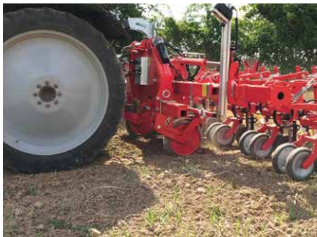
Hackgerätetypen wie der ChopStarTwin von Einböck eignen sich sehr gut für Mulchsaatbestände.

Die Ergänzung der klassischen Gänsefußscharhacke mit Zusatzwerkzeugen wie der Fingerhacke ermöglicht ab dem Dreiblattstadium der Kulturpflanzen auch eine Bearbeitung innerhalb der Reihe. Eine wesentliche Weiterentwicklung stellen Spurführungssysteme mit einer Kamerasteuerung des Hackgerätes dar. Damit wird eine exaktere Ausrichtung der Hackwerkzeuge an der Kulturpflanzenreihe und eine für den Fahrer weniger ermüdende Hackarbeit ermöglicht. Für den Einsatz in erosionsmindernden Mulchsaatbeständen haben sich Hackgeräte mit vorlaufenden Räumscheiben und Winkelscharen, die entlang der Kulturpflanzenreihe geführt werden, bewährt. Mit dieser Ausstattung ist ein schmales Hackband möglich und die Geräte sind wenig verstopfungsanfällig.