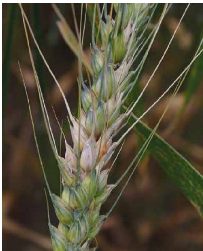
Probleme mit Ährenfusariosen bzw. mit Fusariumtoxinen im Produkt treten im Biokonsumgetreideanbau nur in seltenen Fällen auf.