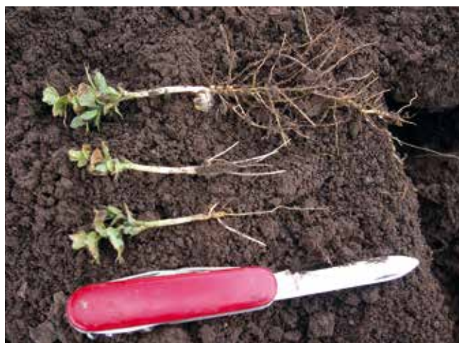
Fußkrankheiten sind der Hauptgrund für die empfohlenen langen Anbauabstände für Körnererbsen.