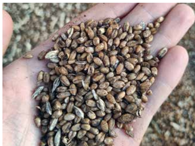
Steinbrandbelastetes Erntegut wird in der Bio-Lagerstelle nicht übernommen!

Der Anbau hochwüchsiger Getreidesorten bzw. von Sorten mit rascher Jugendentwicklung (z. B. Mais, Soja)