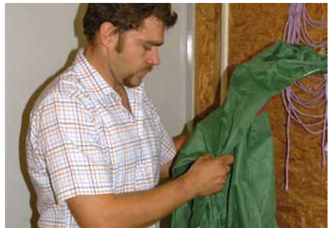
Im Quarantänebereich sind eigene Bekleidung, Stiefel und Gerätschaften zu verwenden, die nicht gleichzeitig bei der bestehenden Herde verwendet werden dürfen.