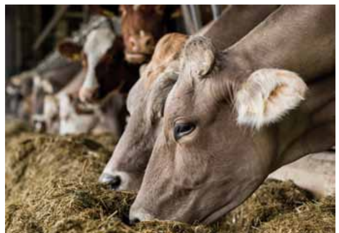
Futtermittelverschmutzungen sind unbedingt zu vermeiden. Hygienisch einwandfreie Futtermittel sind Voraussetzung für optimale Leistungen.

Die Verunreinigung der Grünflächen und in weiterer Folge der Futtermittel durch Hundekot stellt auch in Hinblick auf die Neosporose ( Neospora caninum ) ein Problem dar. Diese Infektionskrankheit bewirkt bei infizierten Kühen erhebliche Fruchtbarkeitsstörungen, wie z.B. Aborte. Zudem findet eine Übertragung der Infektionskrankheit von infizierten, trächtigen Kühen auf das ungeborene