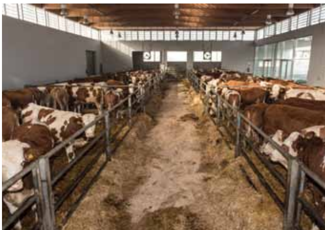
Quarantänemaßnahmen im Ausmaß von mindestens 3 Wochen (besser 6 Wochen) dienen dazu, die eigene Herde vor möglichen Infektionen durch die zugekauften Tiere zu schützen (Quelle: agrarfoto.com).

In der Quarantäne können Tiere auf erkennbare Atemwegs-, Darm-, Haut- oder Eutererkrankungen untersucht werden. Labordiagnostische Maßnahmen können einen festgelegten Gesundheitsstatus (z.B. Freiheit von Paratuberkulose, Staphylokokkus aureus) absichern.