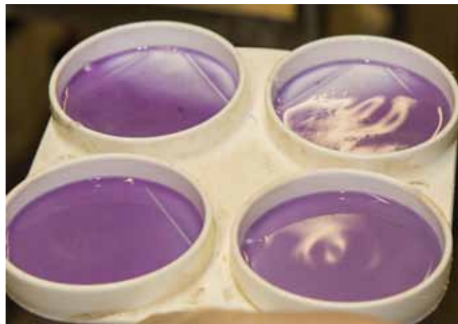
Der Hygiene im Melkstand bzw. der Eutergesundheit ist große Beachtung zu schenken.

der Geburtsregion des Tieres sowie von Händen und Armen. Das Tragen sauberer Kleidung (Geburtskittel) und die Verwendung von gereinigten und desinfizierten Stricken wird empfohlen.