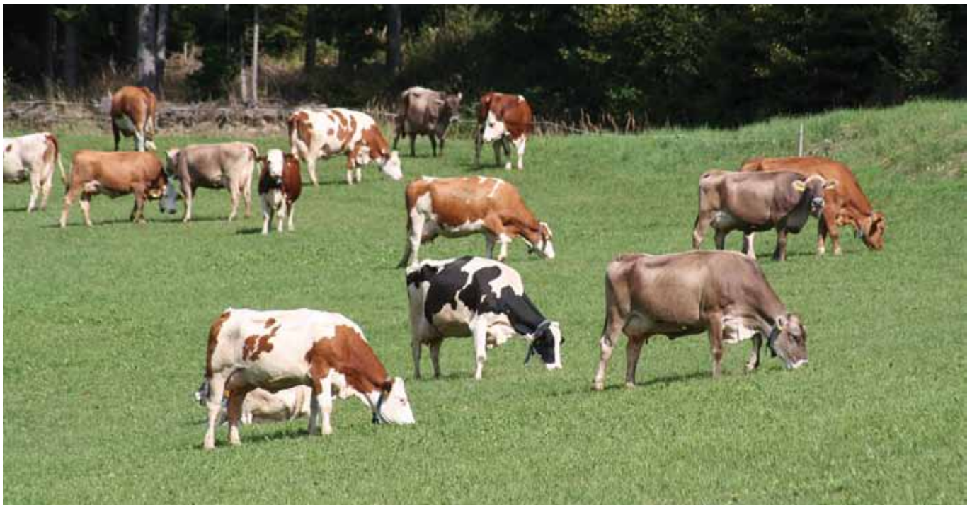
Biosicherheitsmaßnahmen sollen dazu beitragen, die eigene Herde bestmöglich gegen Krankheiten zu schützen.

Interne Biosicherheit umfasst Maßnahmen, die die Ausbreitung von Krankheiten innerhalb landwirtschaftlicher Betriebe bekämpfen.