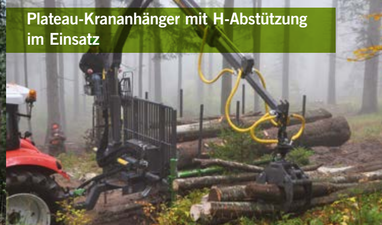
Plateau-Krananhänger mit H-Abstützung im Einsatz