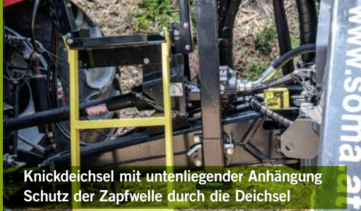
Knickdeichsel mit untenliegender Anhängung Schutz der Zapfwelle durch die Deichsel