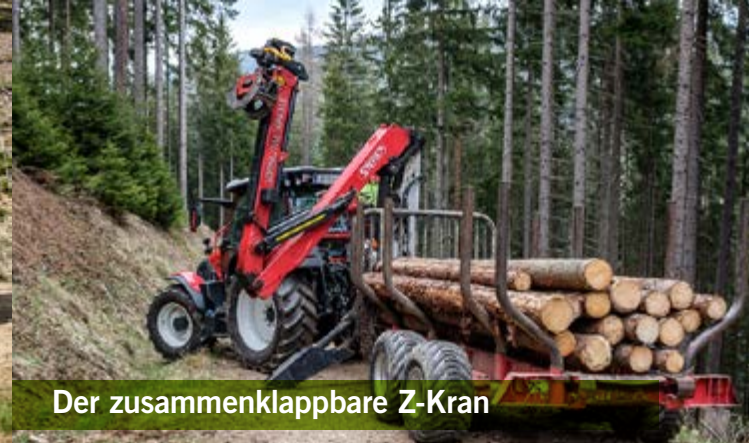
Der zusammenklappbare Z-Kran