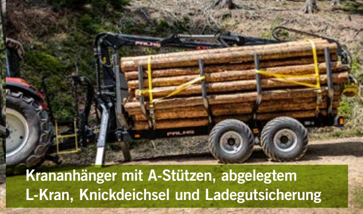
Krananhänger mit A-Stützen, abgelegtem L-Kran, Knickdeichsel und Ladegutsicherung